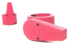
KAMCOL2 Pierścień zaciskowy (50mm) (CZERWONY)