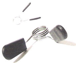
SA7113 Sprężynowy Pierścień Olimpijski (50mm)

Pierścienie te mają postać ekonomicznych i plastikowych tulejek, które znacznie ułatwiają chwyt.