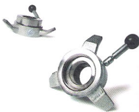
131-50 Pierścień Konkursowe Eleiko 5kg (Zatwierdzone przez IWF/IPF)

Nie tylko są one bardzo bezpieczne, lecz ponadto zostały zaprojektowane w sposób ograniczający ich grubość, co umożliwia dodawanie dodatkowych dysków do sztang.